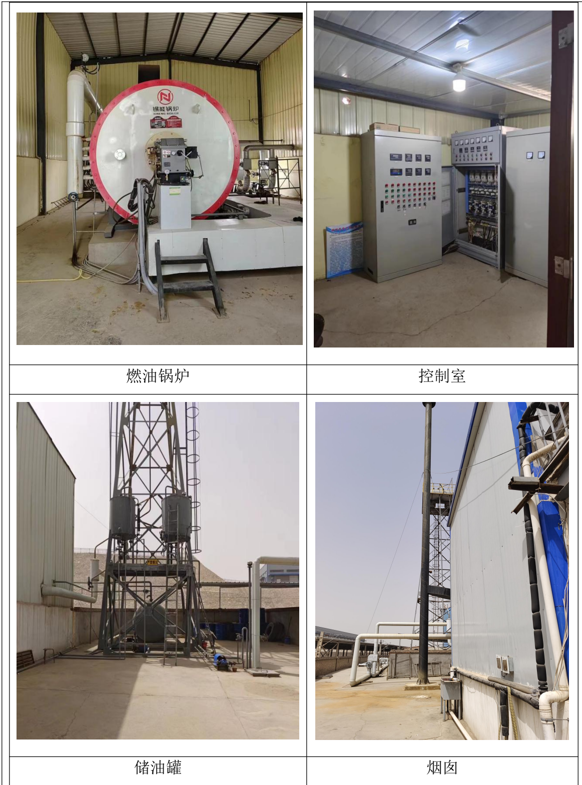
图 2-3 项目现状生产线及设备图